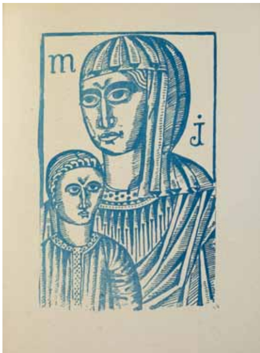
Émile Bernard | Madone | gravure, l'Ymagier, n°3, 1895