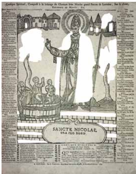
Sancte Nicolae. Ora Pro Nobis | bois de fil, 1664, Cardinet, Épinal