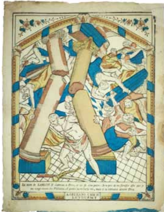
La mort de Samson | bois de fil, entre 1774 et 1800, Letourmy, Orléans | Coll. MIE, dépôt MDAAC