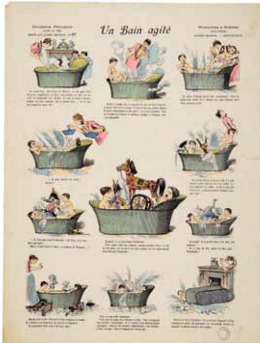
Un bain agité / Albert Robida, dessinateur / zincographie, 1892, Pellerin, Épinal / Coll. MIE