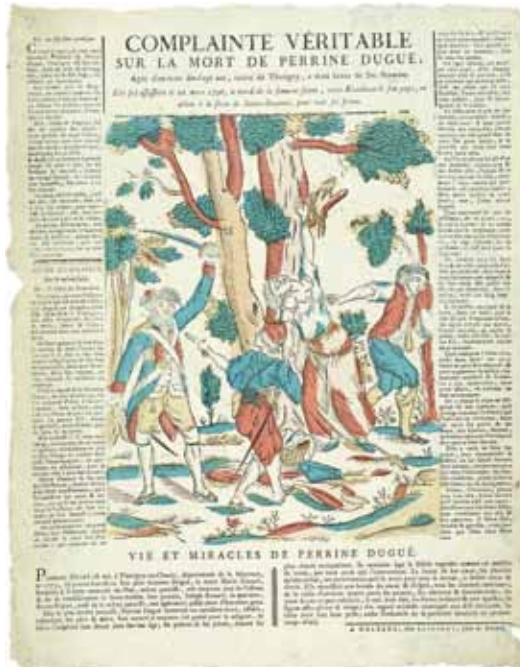
Complainte véritable sur la mort de Perrine Dugué | bois de fil, 1796. Letourmy, Orléans | Coll. MIE, dépôt MAAC