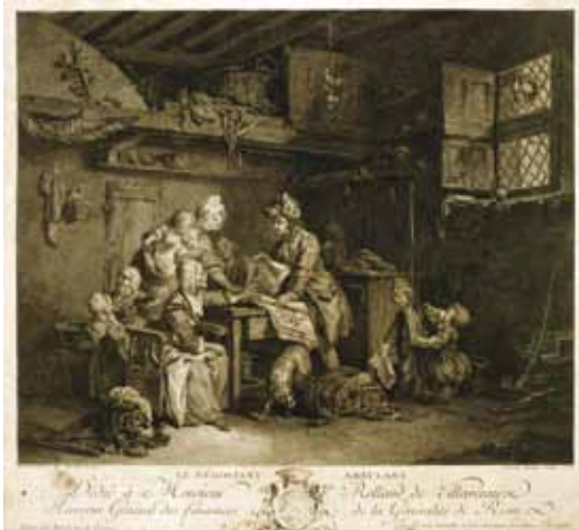
Le négociant ambulant | J. Ingoüf et S. Freudeberg, graveurs | eau-forte, 1777 | Coll. Musée départemental breton, Quimper