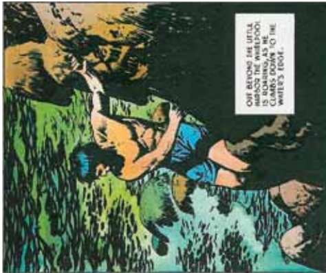
Prince Valiant | Harold Foster | planche dominicale du 11 mai 1941 (extrait) / Lancelot n° 131 | éditions aventures et voyages | septembre 1966, p. 46 (extrait) | Coll. part.