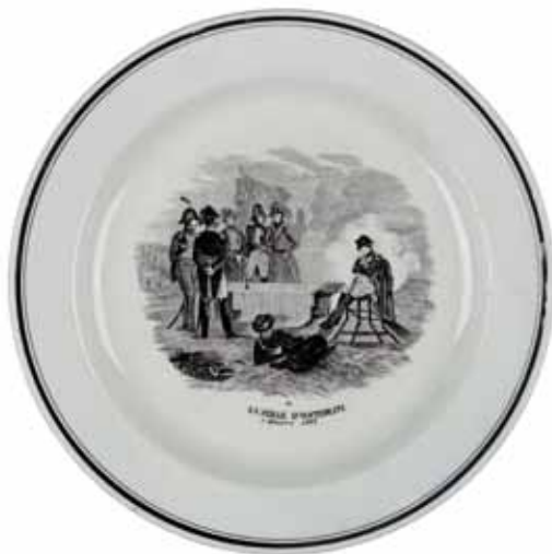
Assiette décorative | VILLE D'AUSTERLITZ | d'après A. Roehn | céramique | 1830 | Coll. Musée de la Faïence de Sarreguemines