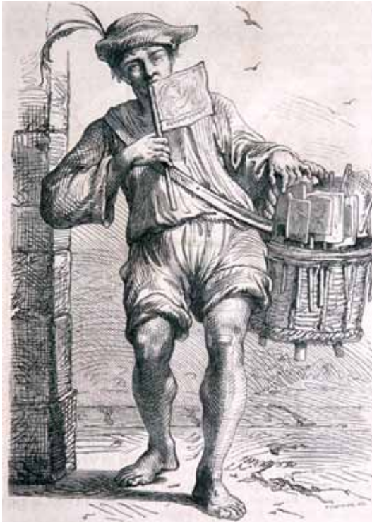
Marchand d'éventails à Bologne au 17 e siècle, par Metelli