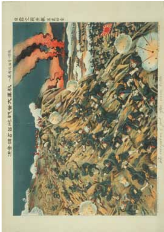
The occupation of fort after severe battle | chromolithographie, 1904, Tokyo, Japon