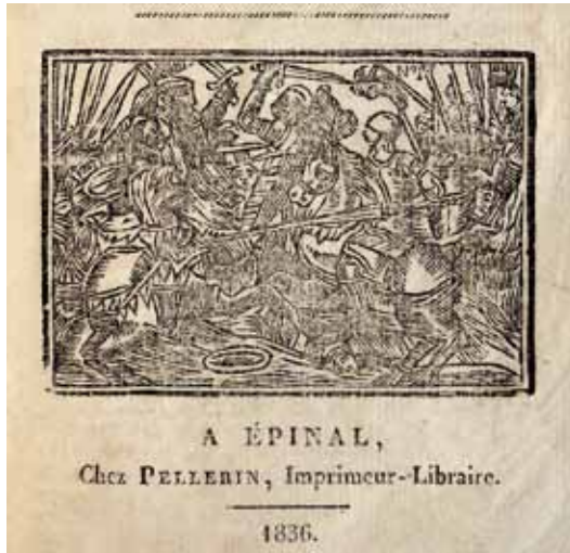
Livret de colportage (détail), 1836, Pellerin, Épinal / Coll. part.