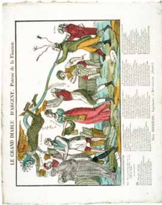
LE GRAND DIABLE D'ARGENT, Patron de la finance / bois de fil, 1820, Pefferlin, Épinal / Coll. M.E. dépôt MDAAC