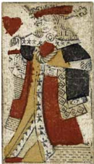
Roi de cœur au portrait de Lorraine (avec sceptre à croix de Lorraine) / bois colorisé, 17 e siècle, Lorraine | Coll. M.E. dépôt MDAAC