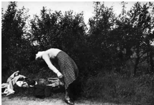
Photographie extraite de la série «Incidental gestures»