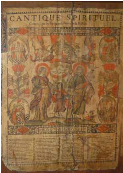
Partie de mur de la maison Tracq en Haute-Maurienne (détail)