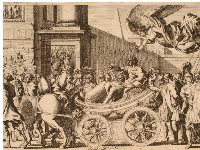
LE TRIOMPHE DE JULES CÉSAR

Gravure de Lepautre | 1683. Collection Musée des Beaux-Arts, Nancy