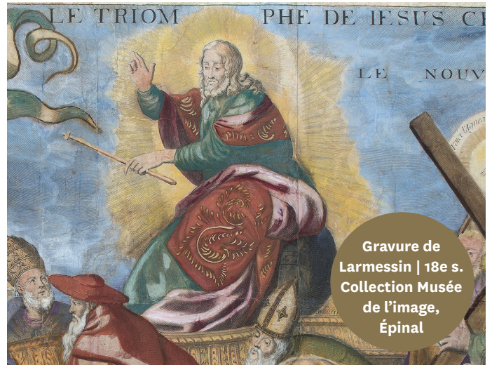
LE TRIOMPHE DE JÉSUS-CHRIST (DÉTAIL)

César est montré en armure car il a gagné des guerres. Jésus-Christ est entouré d'une auréole pour montrer aux croyants ses miracles et les Bleus défilent en T-shirt de sport !