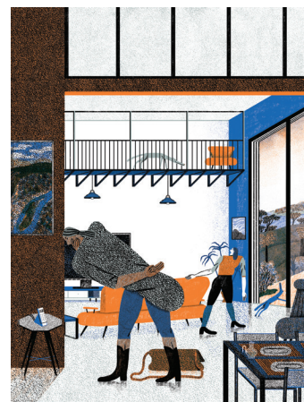
SALLE À MANGER techniques mixtes © Quentin Duckit. 2019