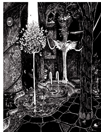
SALLE DE BAIN stylos à bille et encre noire © Cédric Philippe. 2019

« Dans la salle de bain, il y a des siphons noirs où coulent nos humeurs. Il y a des robinets qui délivrent une eau étrangement pure : par où est-elle passée celle-là, pour être si pure ? Et que de brillances dans cette salle de bain ! Tout est briqué ! On veut effacer la nuit derrière cette blancheur ! Mais là-dessous se tordent des canalisations sombres et recroquevillées. Des choses gargouillent dans ce labyrinthe : certaines minuscules et d'autres longues et sinueuses dont on ne sait pas où leur corps mou s'arrête. On tente de percevoir, en vain, le goutte-goutte dans la nuit glauque. Les humains n'habitent pas les salles humides. Ils marchent au-dessus, une savonnette à la main, sans douter de leur étrange beauté. »