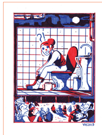
TOILETTES feutres © Victor Husssenot. 2019