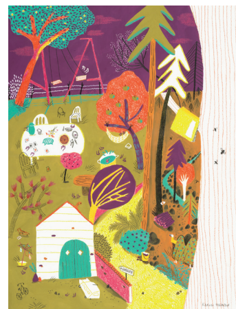
JARDIN peinture et collage © Karine Maincent. 2019

Le jardin était le principal lieu de vie. Il y avait les cabanes construites avec des couvertures, l'odeur de l'orage et les fourmis ailées, les attaques d'orties, les parties de rami de mamie, la balançoire et les hamacs que l'on se partageait, l'odeur de l'herbe coupée, les grands jeux et les grandes tablées, le chien Titus, Marguerite la vache et les virées en vélo ! De magnifiques fruitiers habitaient le jardin : à nous les tartes aux mirabelles et les pommes à croquer. Et par-delà la clôture, encore plein d'aventures ! »