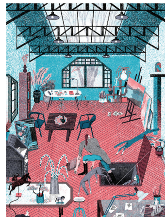
BUREAU - ATELIER techniques mixtes © Quentin Duckit. 2019

Dans certains cas, c'est une pièce de second plan, un bureau vide ou moyennement encombré, signe d'une fréquentation peu assidue. Dans d'autres cas, c'est une pièce foisonnante d'activités, meublée avec soin, de manière fonctionnelle ou purement esthétique.