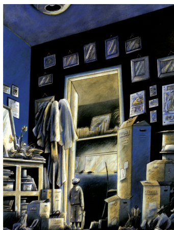
SEUIL D'ENTRÉE bic, crayons de couleurs, aquarelle © Léo Poisson. 2019

Léo Poisson s'empare du seuil d'entrée, de la chambre des parents et de la cuisine.