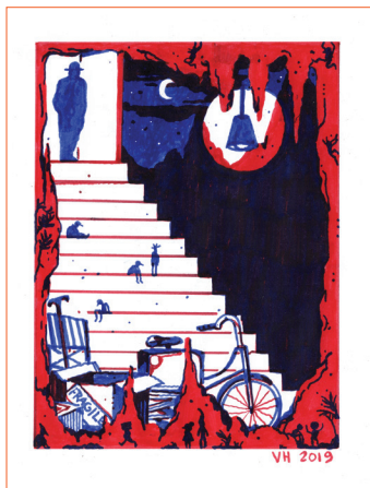
GARAGE - DÉBARRAS feutres © Victor Husssenot. 2019

Victor Husssenot dessine le garage, les toilettes et le salon.