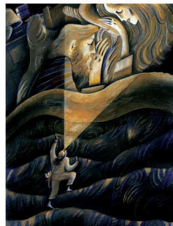
CHAMBRE DES PARENTS bic, crayons de couleurs, aquarelle © Léo Poisson. 2019

« Missions secrètes, excursions clandestines ou quêtes de trésor, la maison est parfois le décor de grandes aventures. Suivez ici les échappées nocturnes de deux enfants et entrez dans l'intimité de leur foyer. Je vous invite à fouiller ces lieux et ces histoires, recomposés d'après mes propres souvenirs. Peut-être y trouverez-vous des familiarités voire un passé partagé ? »