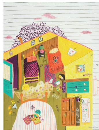
CHAMBRE DES ENFANTS peinture et collage © Karine Maincent. 2019

La chambre des enfants, espace de grandes rêveries, était en haut d'un escalier. Le matin, un filet de lumière passait par les petits trous des volets verts. L'odeur du café de mamie et du pain grillé venaient nous extirper d'épais édredons. Sur les murs, on y retrouvaient des croquis de papi, des images de poulbots... Il y avait même un pot de chambre jaune, des papillons de nuit, un gros baladeur, une tapette à souris, des lectures estivales et un balcon en bois offrant une vue sur la campagne environnante. »