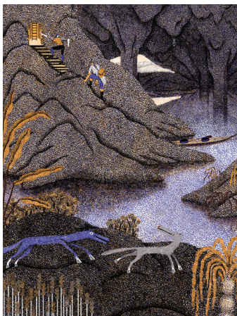
CAVE techniques mixtes © Quentin Duckit. 2019

Quentin Duckit explore la cave, le bureau et la salle à manger.