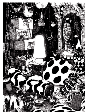
CHAMBRE D'AMIS stylos à bille et encre noire © Cédric Philippe. 2019

« La chambre d'amis doit être impersonnelle, mais suffisamment chaleureuse pour que chacun s'y sente bien. Il lui faut une dose de charme, un aspect esthétique consensuel, un peu de la personnalité de ses propriétaires et une lampe à la lumière ni trop forte, ni trop rose. Tu y trouveras tout ce qu'il faut. Des matelas, des couettes, de la nourriture roborative, des livres, une fenêtre qui laisse chanter les oiseaux et des amis autour d'un feu. Tu pourras y faire la fête, parfois. Tu pourras y rencontrer, ou juste passer et rester inconnu. C'est ça, la chambre d'amis ! Un lieu de passage où s'accrochent les rêves, les espoirs, les histoires, les voyages et les miettes de pain. »