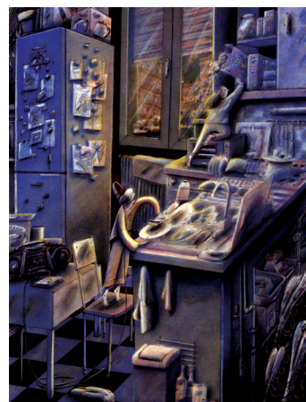
CUISINE bic, crayons de couleurs, aquarelle © Léo Poisson. 2019

« Missions secrètes, excursions clandestines ou quêtes de trésor, la maison est parfois le décor de grandes aventures. Suivez ici les échappées nocturnes de deux enfants et entrez dans l'intimité de leur foyer. Je vous invite à fouiller ces lieux et ces histoires, recomposés d'après mes propres souvenirs. Peut-être y trouverez-vous des familiarités voire un passé partagé ? »