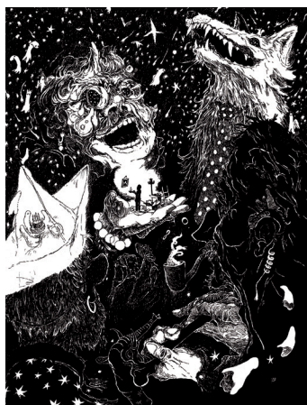
GRENIER stylos à bille et encre noire © Cédric Philippe. 2019

Cédric Philippe s'installe dans le grenier, la salle de bain et la chambre d'amis.