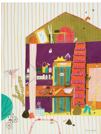
COULOIR peinture et collage © Karine Maincent. 2019

Karine Maincent visite le couloir, la chambre des enfants et le jardin.