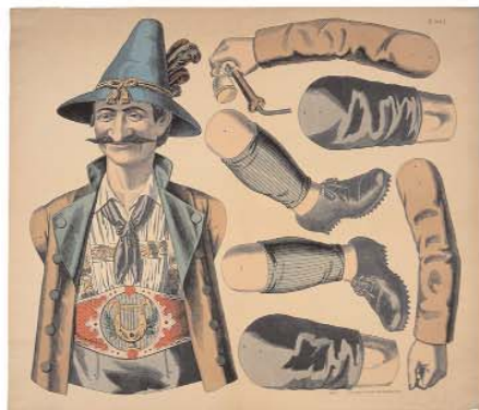
Pantin : le tyrolien N° 364f Les successeurs de C. Burckardt, Wissembourg, entre 1888 et 1897 Coll. MIE, dépôt MDAAC