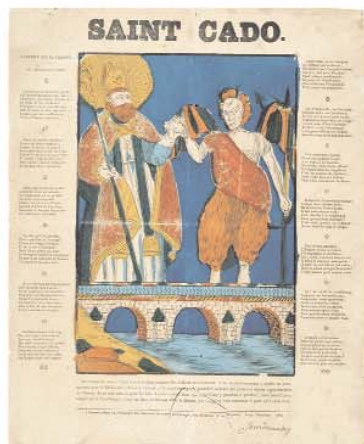
Saint Cado , de C. Pierret C. Pierret fils et Oberthur, Rennes, 3e quart 19e siècle Coll. MIE, dépôt MDAAC