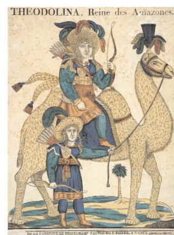
Théodolina , de J.B. Thiébault Desfeuilles, Nancy, 1829 Coll. MIE, dépôt MDAAC