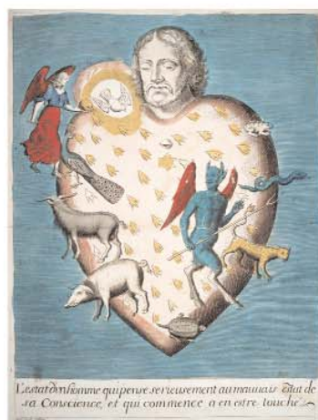
L'Estat d'un homme qui pense sérieusement (...) P. Gallays, Paris, début 18e siècle. Coll. MIE, dépôt MDAAC