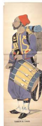
Armée française, Tambour de Turcos Pellerin et Cie, Epinal, entre 1853 et 1880