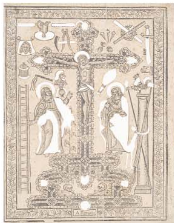
Crucifixion aux instruments de la Passion C. Cardinet, Epinal, vers 1664

Exposition " L'Amour des Images " au Musée de l'Image / Epinal du 1er juillet 2006 au 7 janvier 2007