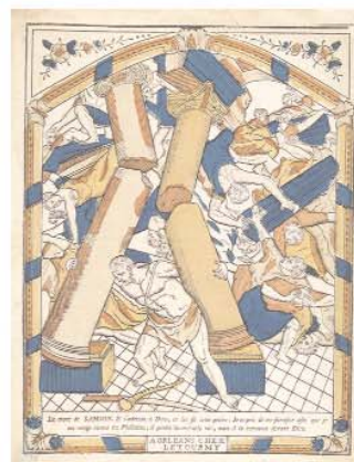
La mort de Samson de J.B. Letourmy Orléans, entre 1774 et 1800 Coll. MIE, dépôt MDAAC