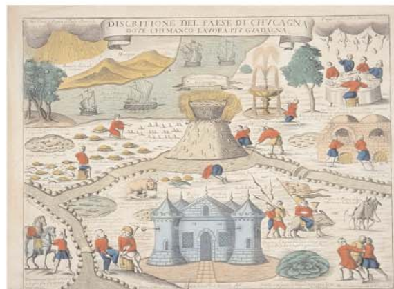
Discritione del paese di Chucagna dove chimanco lavora piu guadagna Remondini, Bassano, 3e quart 17e - début 18e siècle Coll. MIE, dépôt MDAAC