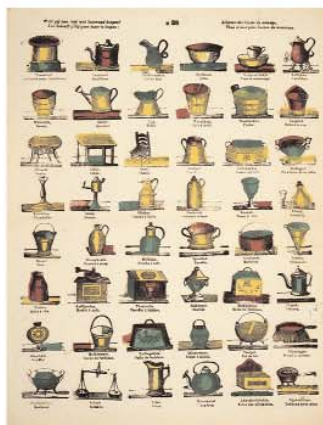
Achetez des objets de ménages (...) Turnhout, vers 1856 - 1900