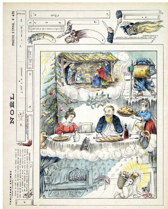
Noël — 1908 — Raoul Lerouge, dessinateur Imagerie d'Épinal — Zincographie coloriée au pochoir

Le petit garçon sage rêve. Il est presque minuit. Pendant qu'un enfant Jésus chargé d'une hotte dépose ses cadeaux dans la cheminée, il rêve au repas de Noël du lendemain. [...]