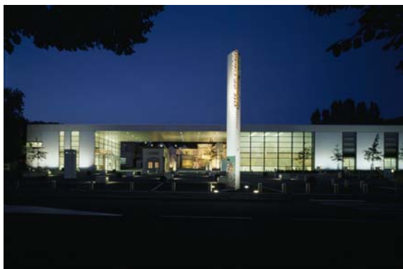
Façade du Musée de l'Image

Dans la salle d'exposition permanente, rénovée en 2006, les textes explicatifs, bornes interactives, montages vidéos... sont autant d'outils complémentaires aux vitrines qui permettent aussi d'aborder les images du 21 ème siècle et de mieux comprendre les milliers d'images populaires conservées dans l'établissement. Des audioguides sont désormais disponibles pour bénéficier des commentaires de la conservatrice du musée sur les images exposées (location 1 euro).