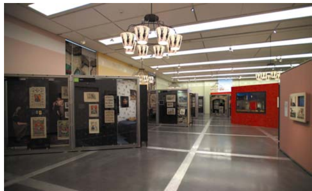
« Image, des images » salle d'exposition permanente du Musée de l'Image

Musée de l'Image | Ville d'Epinal 42 quai de Dogneville 88000 EPINAL Tél : 03 29 81 48 30 - Fax : 03 29 81 48 31 musee.image@wanadoo.fr - www.epinal.fr