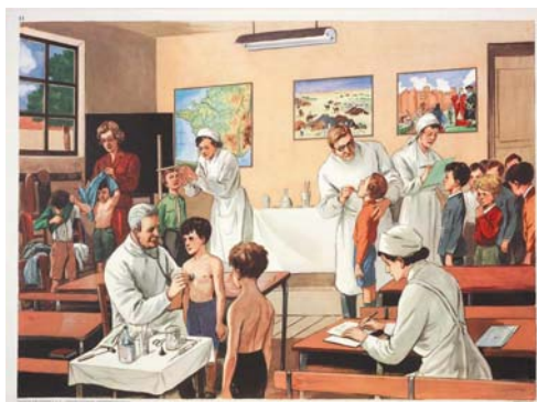
Tableau d'élocution, éd. Rossignol à Montmorillon Vers 1950-1960