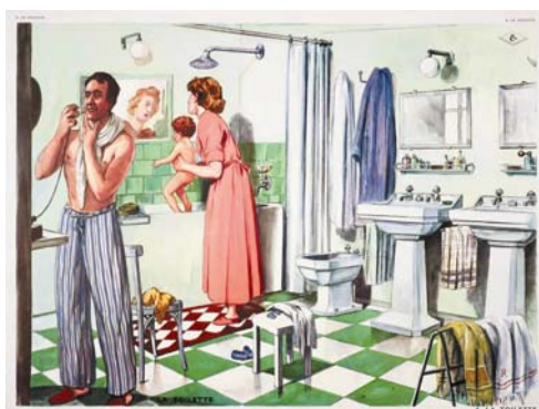
Tableau d'élocution, éd. Rossignol à Montmorillon Vers 1950-1960