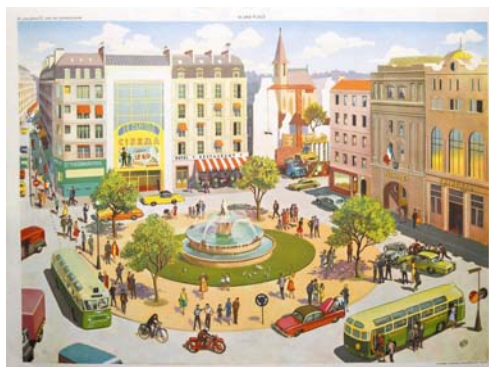
Tableau d'élocution, Coop. pédagogique Nalliers Vers 1950-1960