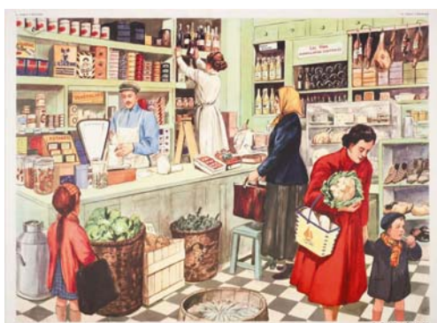
Tableau d'élocution, éd. Rossignol à Montmorillon Vers 1950-1960, coll. part.